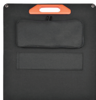
składana konstrukcja /foldable design