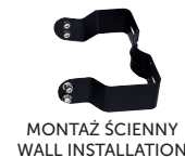
MONTAŻ ŚCIENNY WALL INSTALLATION